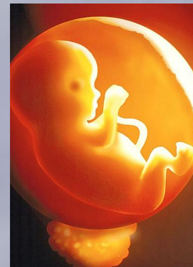
10 semaines après la fécondation - grandeur véritable